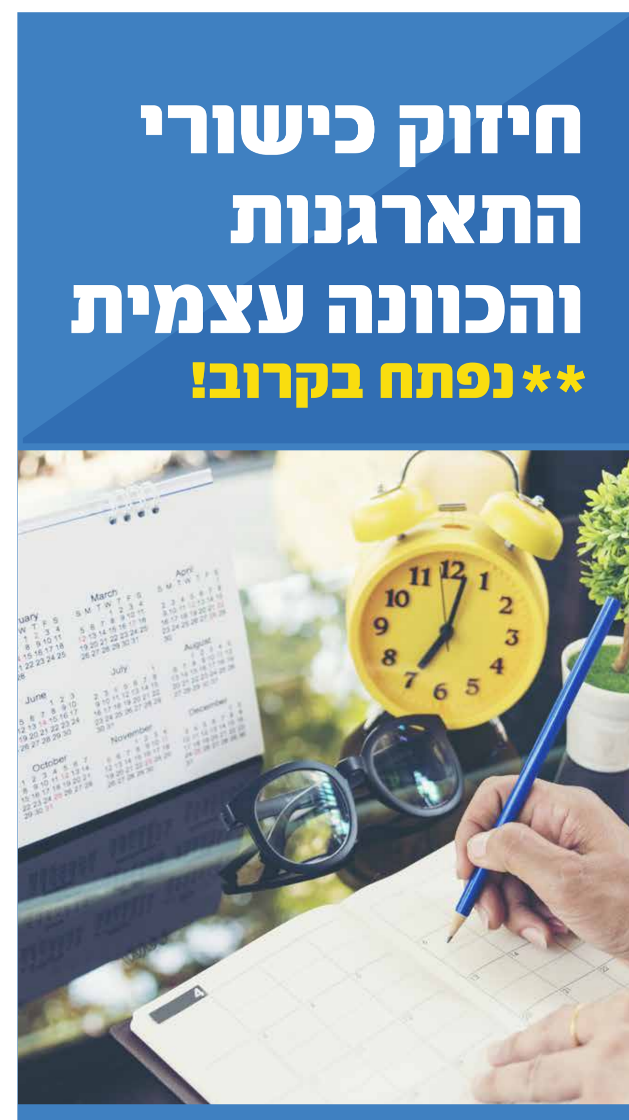
סוף סמסטר א'

חיזוק כישורי התארגנות והכוונה עצמית **נפתח בקרוב!