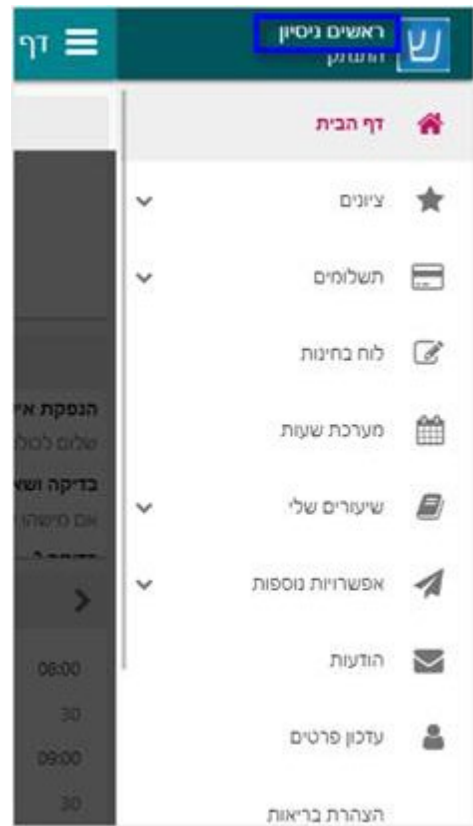
זזהו הכרטיס הדיגיטלי במארטפון: