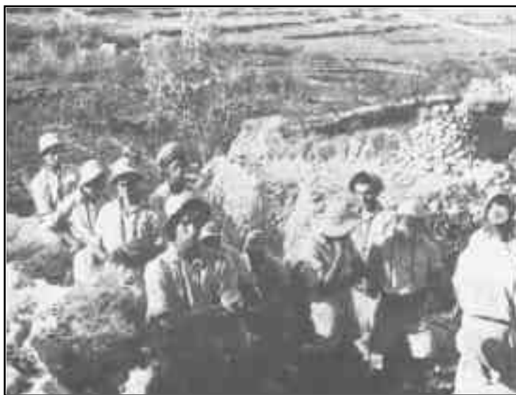
המחלקה הדתית בפלמ"ח – תפילה בשדה בזמן מסע – חנוכה תשי"ג

המו"מ בין הציבור הדתי-לאומי ובין אנשי הפלמ"ח התנהל בין יחיאל אליאש ובין מפקד הפלמ"ח יצחק שדה. באחת הפגישות הציע יצחק שדה לעמיתיו הדתיים להקים מעין "ישיבת הסדר" בפלמ"ח.