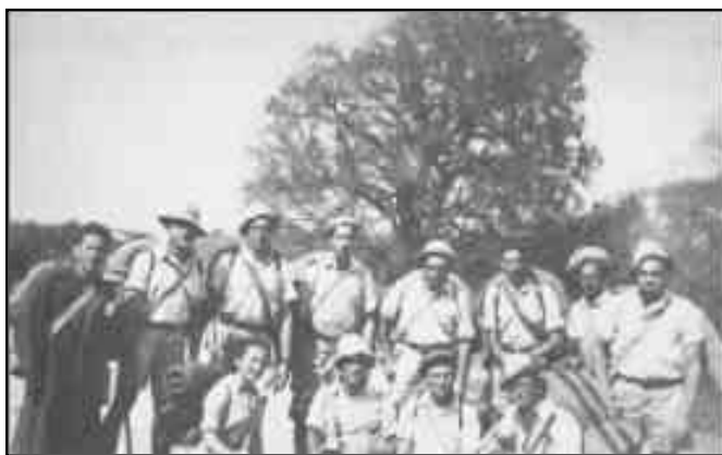
המחלקה הדתית בפלמ"ח – במסע לכפר עציון תשי"ג

במהלך מלחמת העולם השנייה, לאחר נצחונותיהם של הגרמנים בלוב, ביוון ובצפון אפריקה גבר